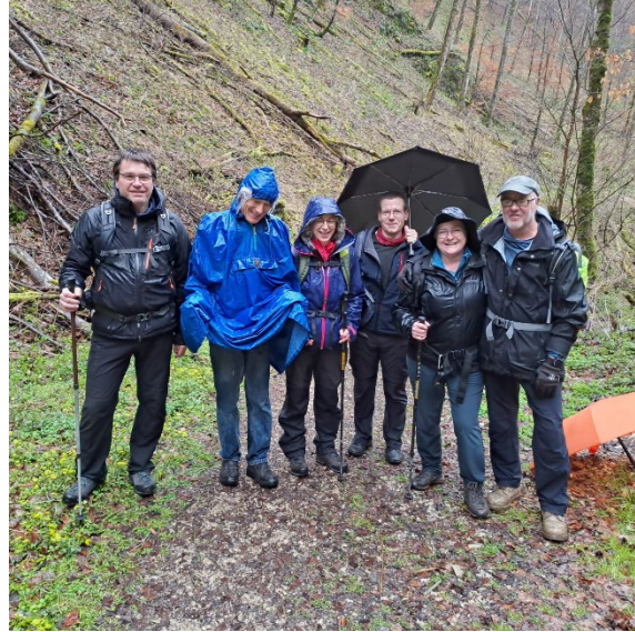
Die muntere Truppe

Text: Marion Rexer