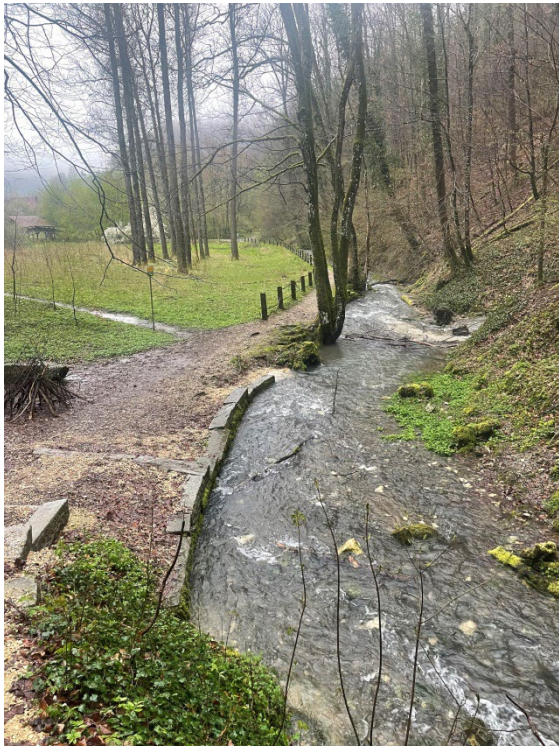
Entlang der Lauter

Im Restaurant Lamm in Grabenstetten lassen wir die Tour in gemütlicher Runde ausklingen.