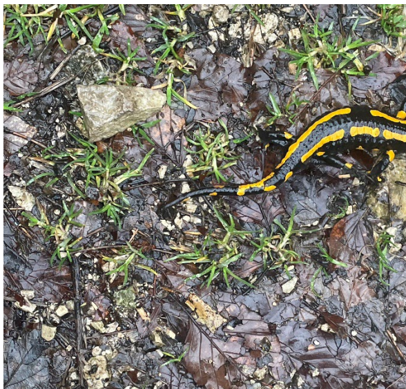
Ein kleiner Weggefährte